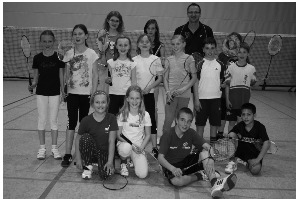
Die Jugendspieler der Badmintonabteilung